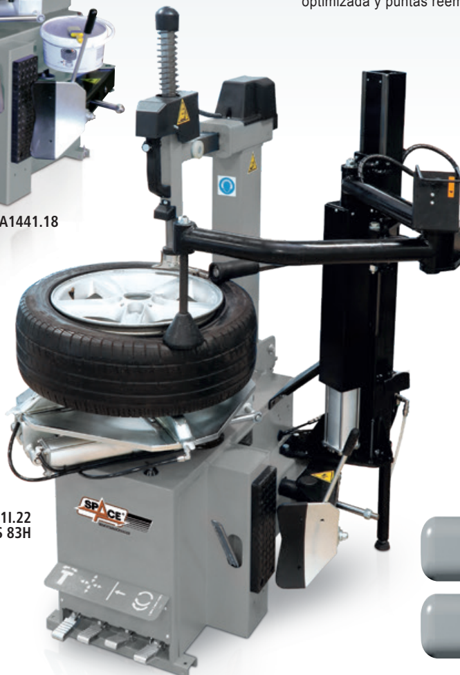
GA2441.22 + PLUS 83H