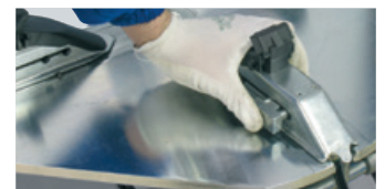
10" - 24" (2 position)